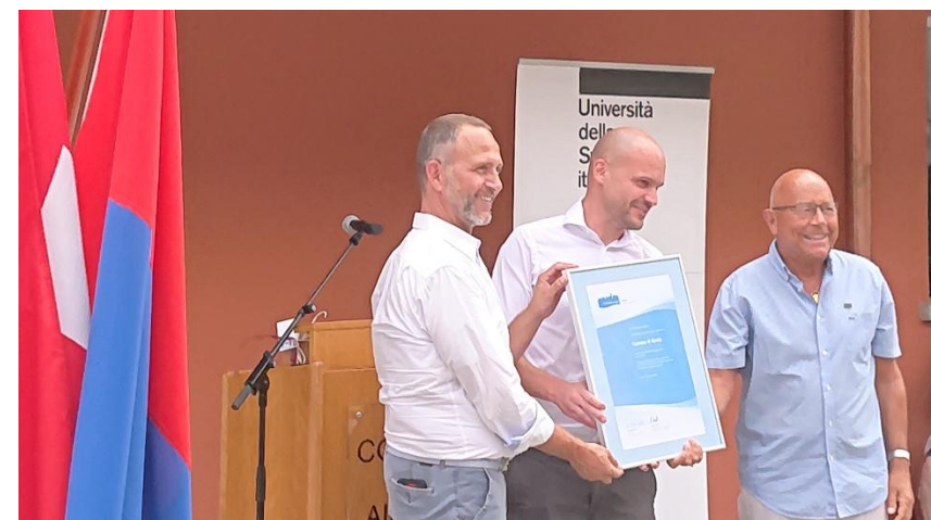
Consegna Label Città dell'energia, Airolo, 1.8.2024