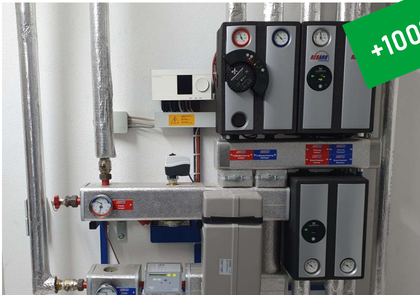
Contributo per il cliente finale