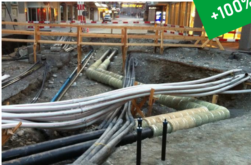
Contributo per il gestore/promotore